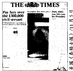
英国《泰晤士报》/11月5日

中国约有 48.9% 的居民有病不就医, 29.6% 应住院而不住院。谈到近一半中国人“有病不医”现象, 中国国务院发展研究中心今年 7 月公布的一份研究报告直言不讳: “问题的根源在于商业化、市场化的走向违背了医疗卫生事业发展的基本规律。” 其实, 除美国等少数国家之外, 大部分发达的市场经济国家都把卫生医疗看作是公共产品, 由政府公款支付其主要费用, 而且, 这些国家都不打算对公共医疗制度实行完全的私有化和市场化改造。