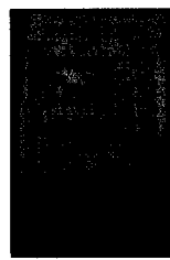
美国《国际先驱论坛报》/11月7日

经确认, 中国民营企业平均寿命仅为 3 年半。这是中国企业专门调查机构慧聪国际资讯小组进行调查的结果。中国民营企业大约有 300 多万家。据慧聪进行的调查, 其中经营 10 年以上的企业仅有 10%。据分析, 中国民营企业寿命短的原因是, 没有独立开发技术和产品的能力, 只依靠价格竞争力。慧聪首席执行官说: “不考虑企业长期利益的基础——研究开发和品牌开发——而是着重于价格竞争, 一味追求眼前利益, 这缩短了企业的寿命。”